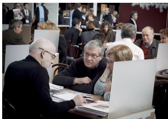
Le pôle concepteurs-installateurs n'a pas désempli durant les deux jours d'ouverture au grand public