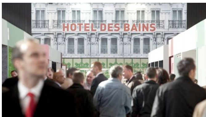
L'allée Mode s DeBain s , qui conduit à la scénographie du Grand Prix de la Salle de Bains d'Hôtel est pôle d'inspirations unique en Europe.