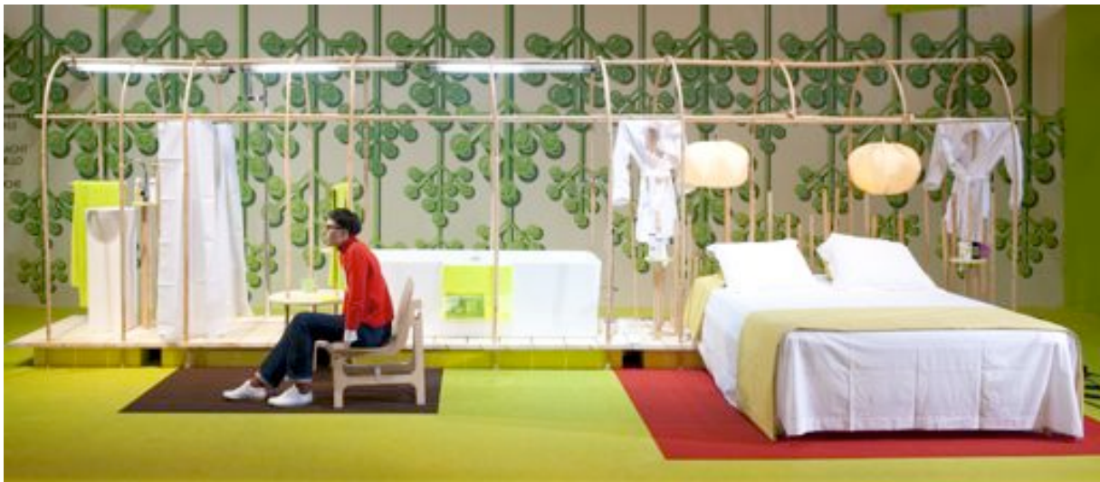
matali crasset Grand Prix 2010 de la Salle de Bains d'Hôtel au cœur de sa scénographie.

La prescription et la maîtrise d'ouvrage représentées à hauteur de 19% du visitorat ont notamment participé à cette atmosphère pouvant préfigurer les premiers pas vers la reprise.